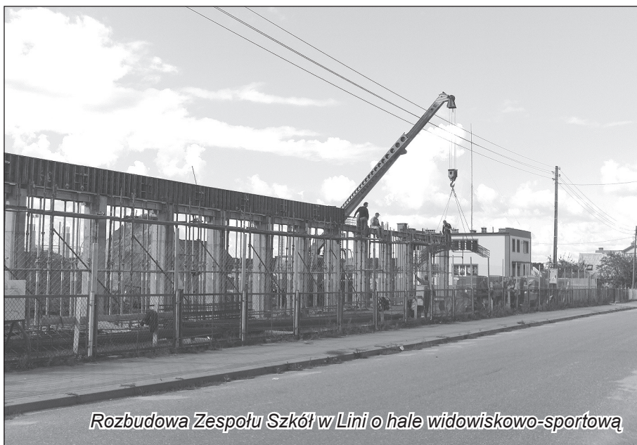
Rozbudowa Zespołu Szkół w Lini o hale widowiskowo-sportową

Przyszła czas pożegnać okres odpoczynku i czas wakacji. Jesień zbliża się dużymi krokami, ale w naszej gminie inwestycje idą „pełną parą”. Mimo trwających robót budowlanych na terenie Zespołu Szkół w Lini, dzieci nie będą miały utrudnionego dostępu do obecnego budynku szkoły ani do zaplecza sportowego. Kompleks boisk „ORLIK” wraz z zapleczem służy nie tylko uczniom ale również mieszkańcom i jest czynny przez wszystkie dni tygodnia. Użytkownicy szkoły, przez okres realizacji inwestycji będą wchodzić do budynku od strony ulicy Łąkowej. Firma ELWOZ, która wygrała postępowanie przetargowe na budowę nowej hali realizuje przedmiot zamówienia terminowo i bez zakłóceń. Prace przy filarach przyszłej hali sportowej oraz fundamentach łącznika są coraz bardziej zaawansowane.