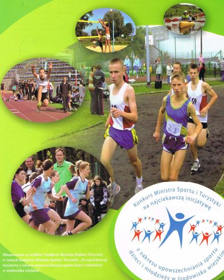
Sfinansowano ze środków Funduszu Rozwoju Kultury Fizycznej w ramach Wieloletniego Planu Sportu i Turystyki. Szereg inicjatyw z zakresu upowszechniania sportu dzieci i młodzieży w środowisku wiejskim”.