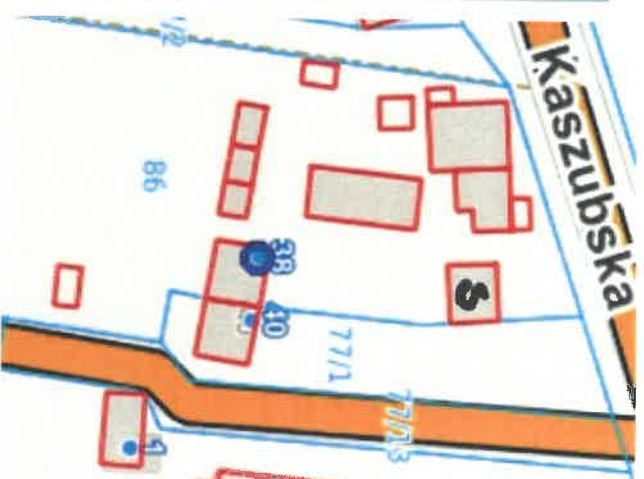
Niepoczołowice 38 – stodoła