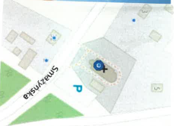
Smażyno 4a – kościół