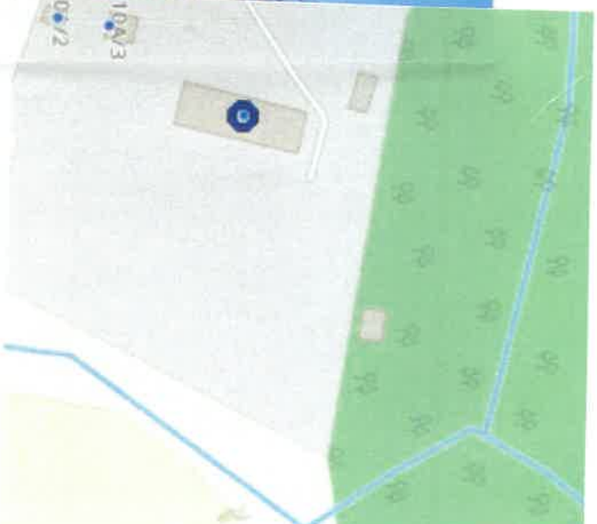
Smażyno 8 – park przy d. pałacu