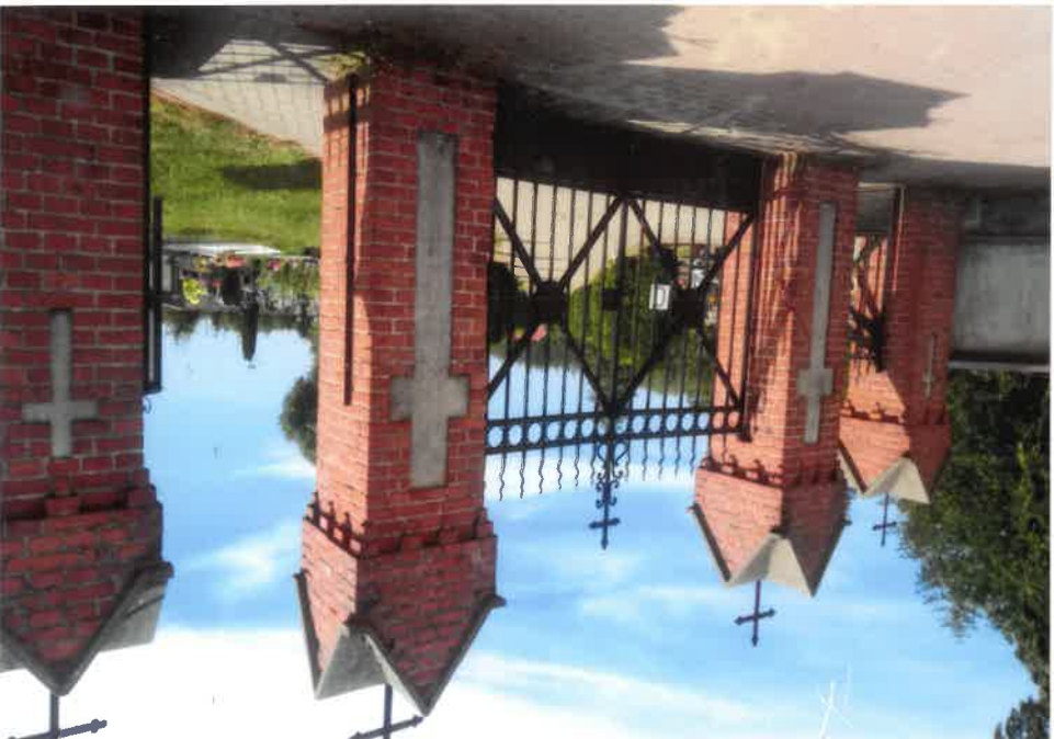
Strzecz – cmentarz katolicki ul. Ks Rotty-Szkolna

8. Fotografia z opisem wskazującym orientację w stosunku do sąsiednich terenów lub stron świata albo mapa z zaznaczonym stanowiskiem archeologicznym